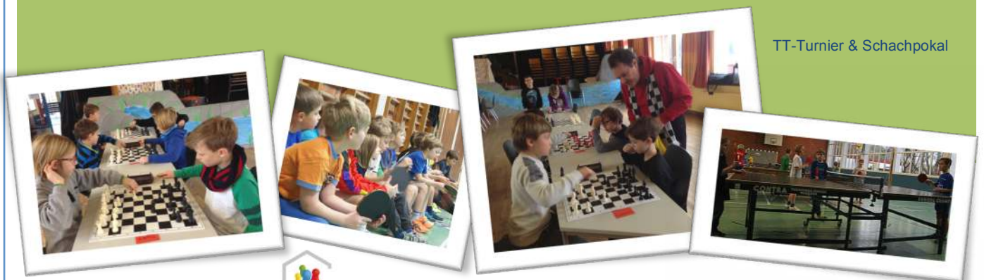
TT-Turnier & Schachpokal