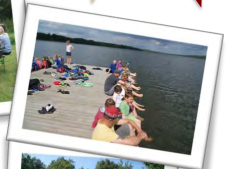
Impressionen aus 10 Jahren Zeltlager in DK